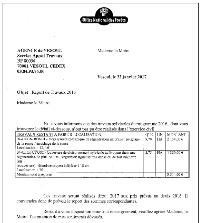
Exemple de document de report de travaux

Les dépenses réalisées pour la création de desserte forestière (routes empierrées, pistes, places de dépôt, aires de retournement, place bois énergie, franchissements de cours d'eau, etc.) sont à imputer sur le compte 2128. L'entretien ponctuel du réseau de desserte est à enregistrer dans le compte 61524.